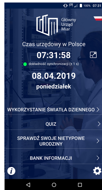
Wersja na urządzenia z