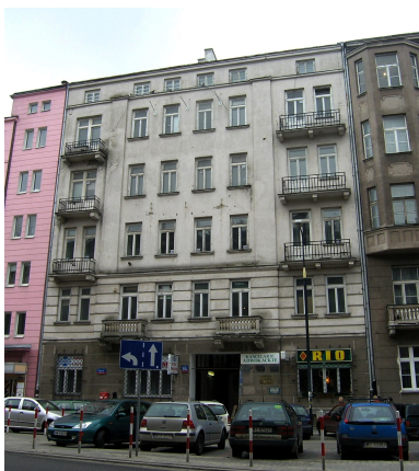
Urząd Miar i Wag m.st. Warszawy. Ulica Piękna 66a – zdjęcie współczesne