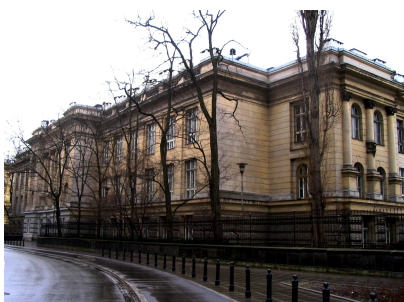
Gmach Chemii Politechniki Warszawskiej – zdjęcie współczesne