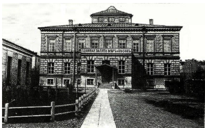
Główna Izba Miar i Wag w Petersburgu