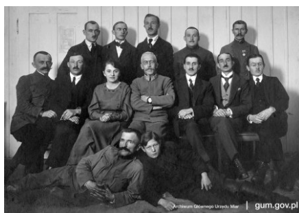
Pracownicy Urzędu Cechowniczego w Lublinie, 1913 r.

[2] Główny Urząd Miar na Elektoralnej , Warszawa 2008, s. 67, 70-73.