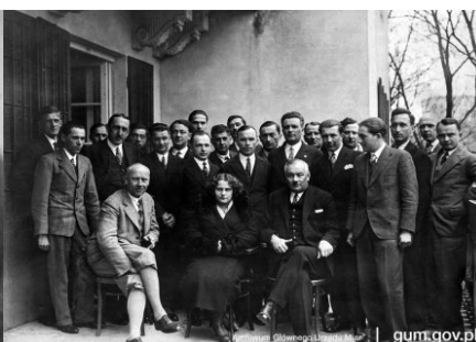
Uczestnicy zjazdu kierowników Okręgowego Urzędu Miar we Lwowie, ok. 1932 r.