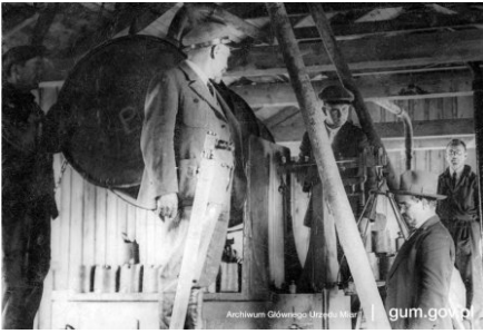
Sprawdzanie zbiorników do ropy naftowej przez pracowników polskiej administracji miar, Schodnica 1932 r.