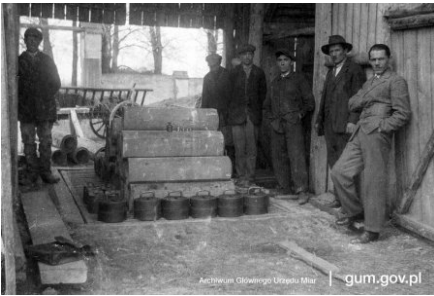
Sprawdzanie wagi wozowej przez pracowników polskiej administracji miar, Bełz k. Żółkwi 1932 r.