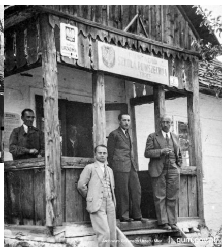
Wizytacja Lotnego Urzędu