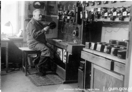
Pracownia Elektryczna Okręgowego Urzędu Miar w Lublinie, 1943 r.