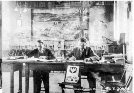
Pracownicy Lotnego Urzędu Miar przy wykonywaniu obowiązków służbowych, 1931 r.