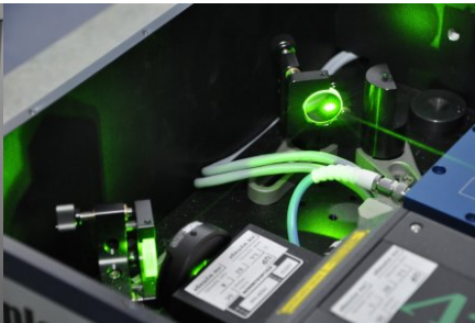
Fragment państwowego wzorca jednostki długości - syntezer częstotliwości optycznych