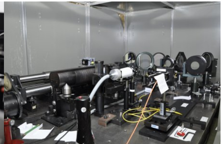
Stano wisko pomiarowe do wzorcowania długich płytek wzorcowych - komparator interferencyjny