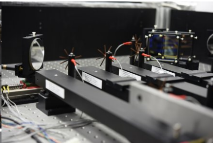
Fragment automatycznego interferometru multispektralnego do wzorcowania długich płytek wzorcowych