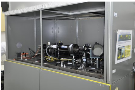
Stano wisko pomiarowe do wzorcowania długich płytek wzorcowych - komparator interferencyjny