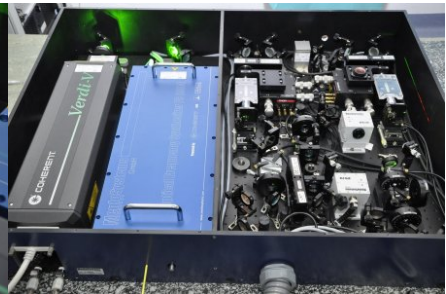
Państwowy wzorzec jednostki długości - syntezer częstotliwości optycznych