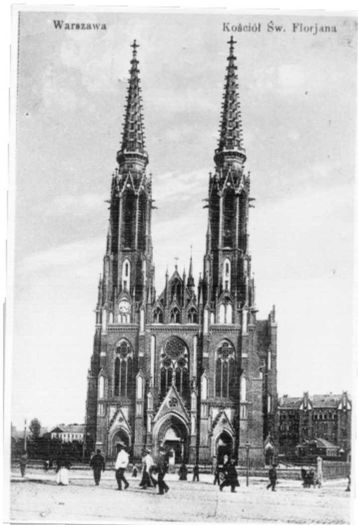
Kościół św. Floriana. Pocztówka sprzed 1915 r.