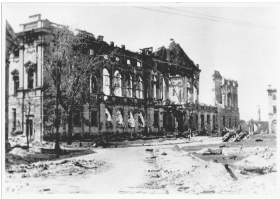
Pałac Krasieńskich. 1945 r.