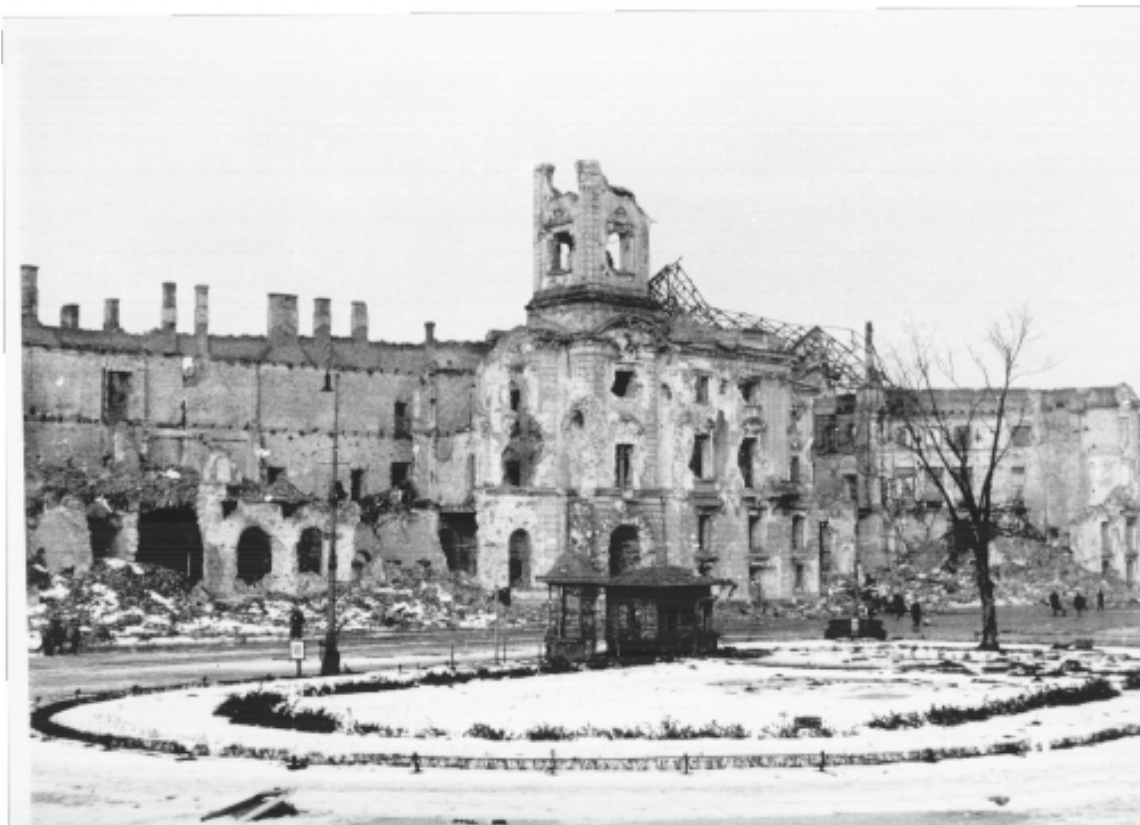
Ruiny Ratusza na placu Teatralnym. Luty – marzec 1945 r.