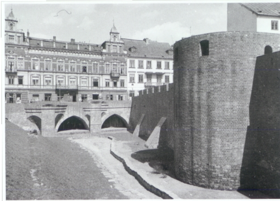
Mury obronne. 1939 r.