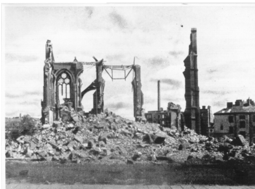
Kościół św. Floriana. Pocztówka z 1945 r.