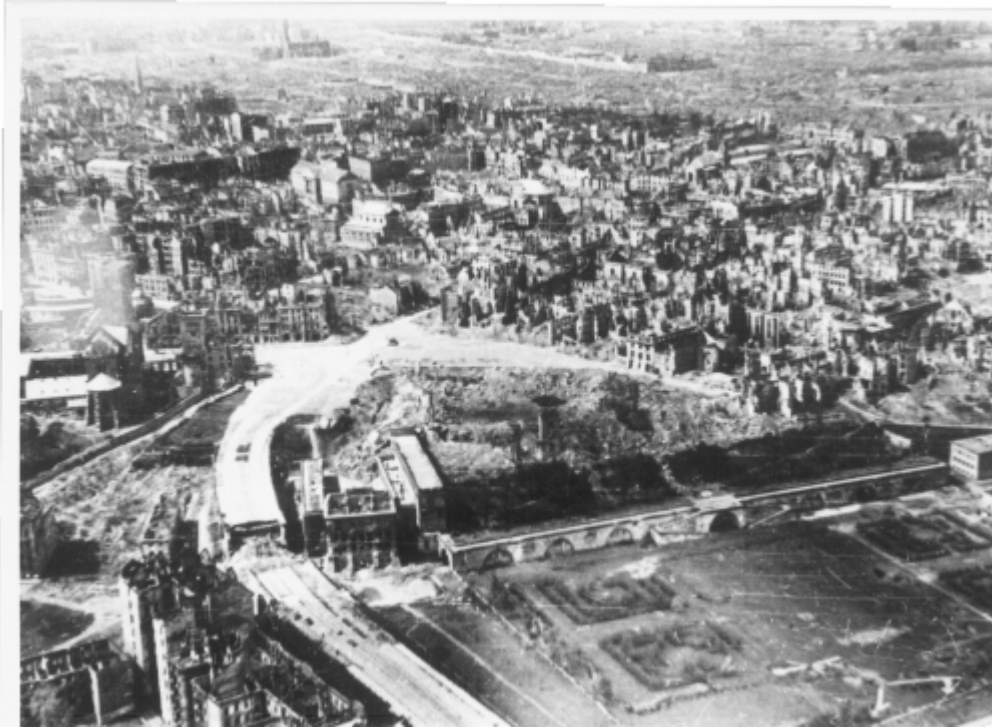
Ruiny Starego Miasta. Zdjęcie lotnicze z 1945 r.