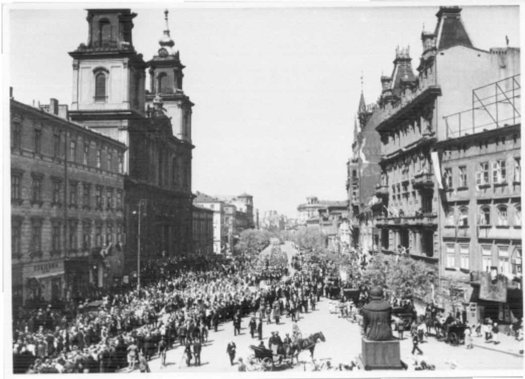
Krakowskie Przedmieście. 1937 r.