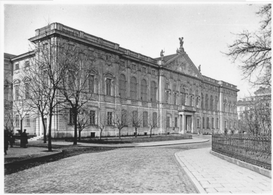
Pałac Krasieńskich. 1930 r.