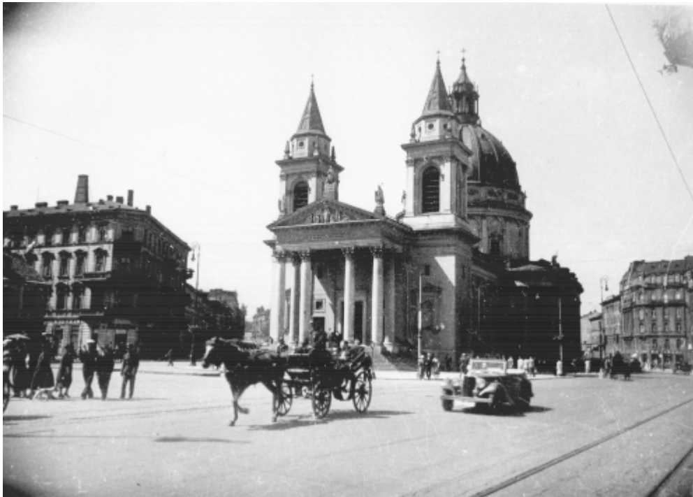
Plac Trzech Krzyży i kościół św. Aleksandra. lata 30. XX w.