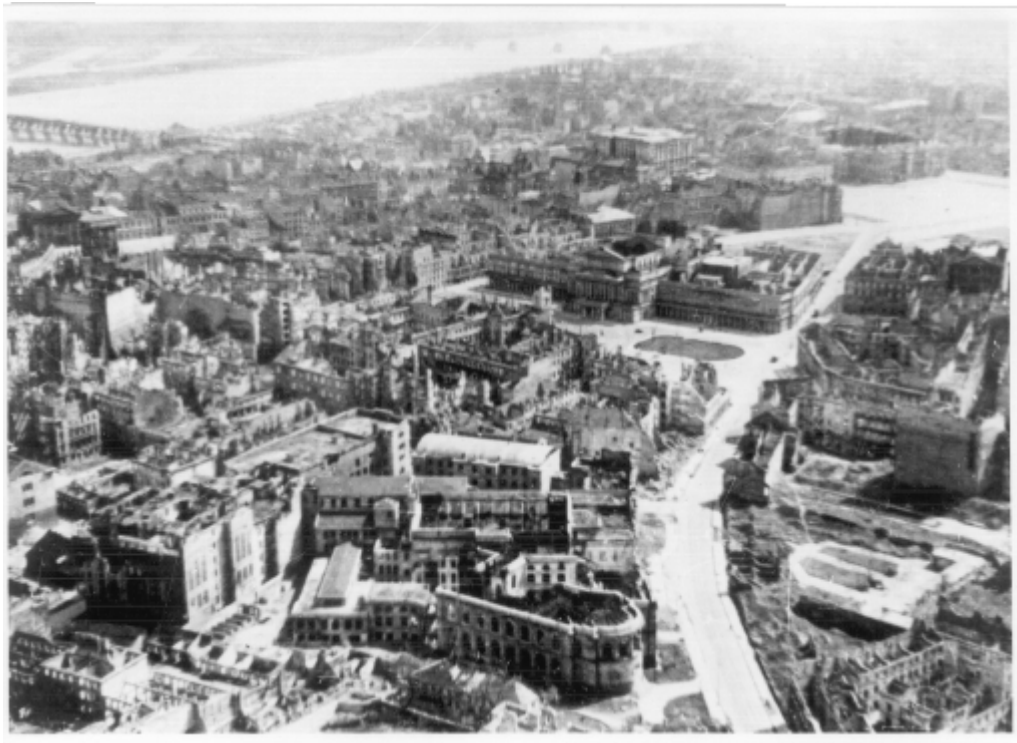
Śródmieście z ul. Bielańską, placem Teatralnym i placem Piłsudskiego. Zdjęcie lotnicze z 1945 r.