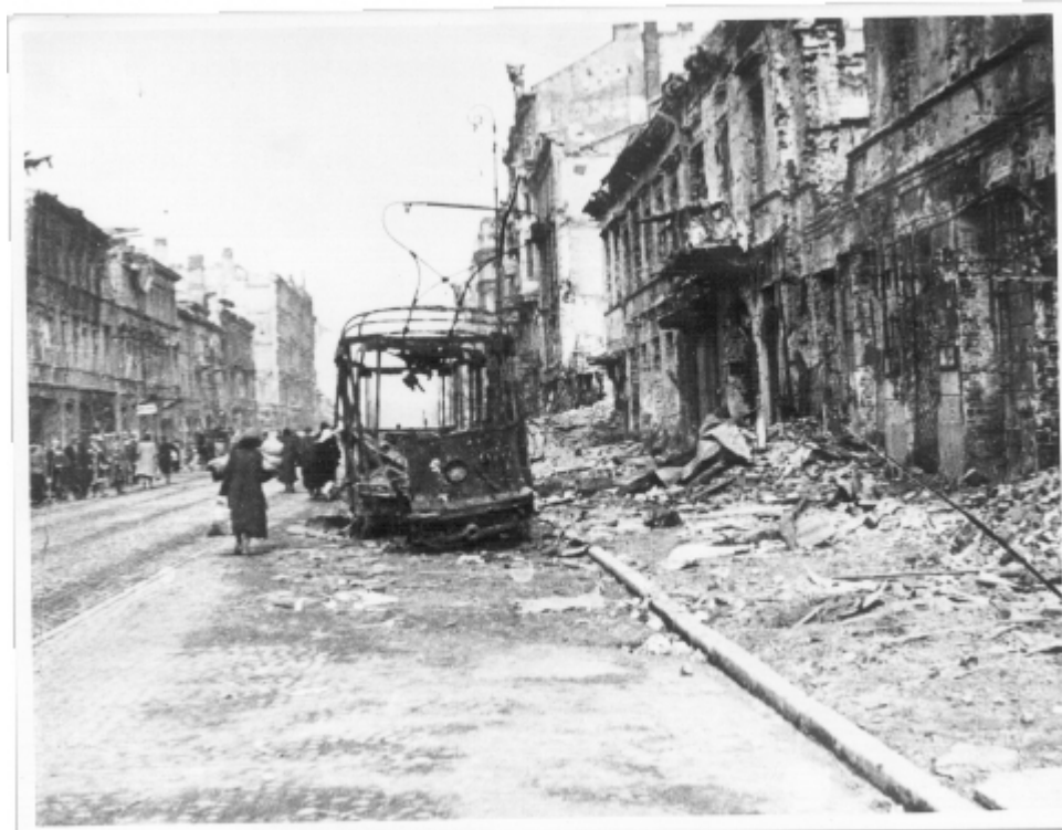
Ul. Marszałkowska, róg Wilczej. Ze zbiorów Muzeum Historycznego w Warszawie