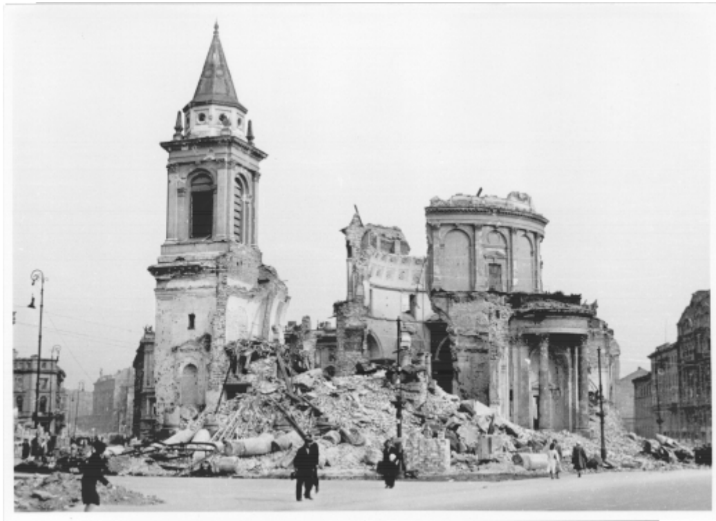
Plac Trzech Krzyży. Kościół św. Aleksandra. kwiecień 1945 r.