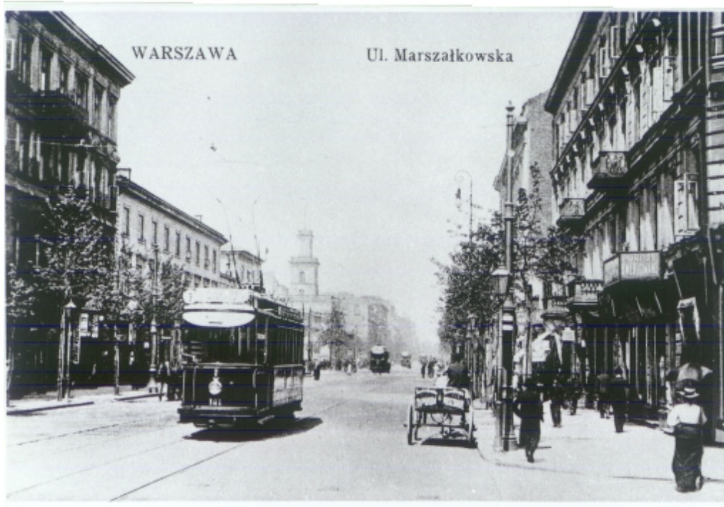
Ul. Marszałkowska przed 1915 r. Reprodukacja pocztówki.