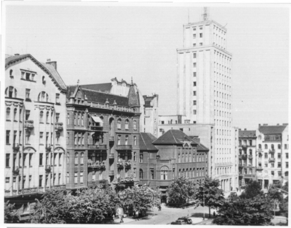
Plac Napoleona (obecnie Plac Powstańców Warszawy) Pocztówka z lat 30. XX w.