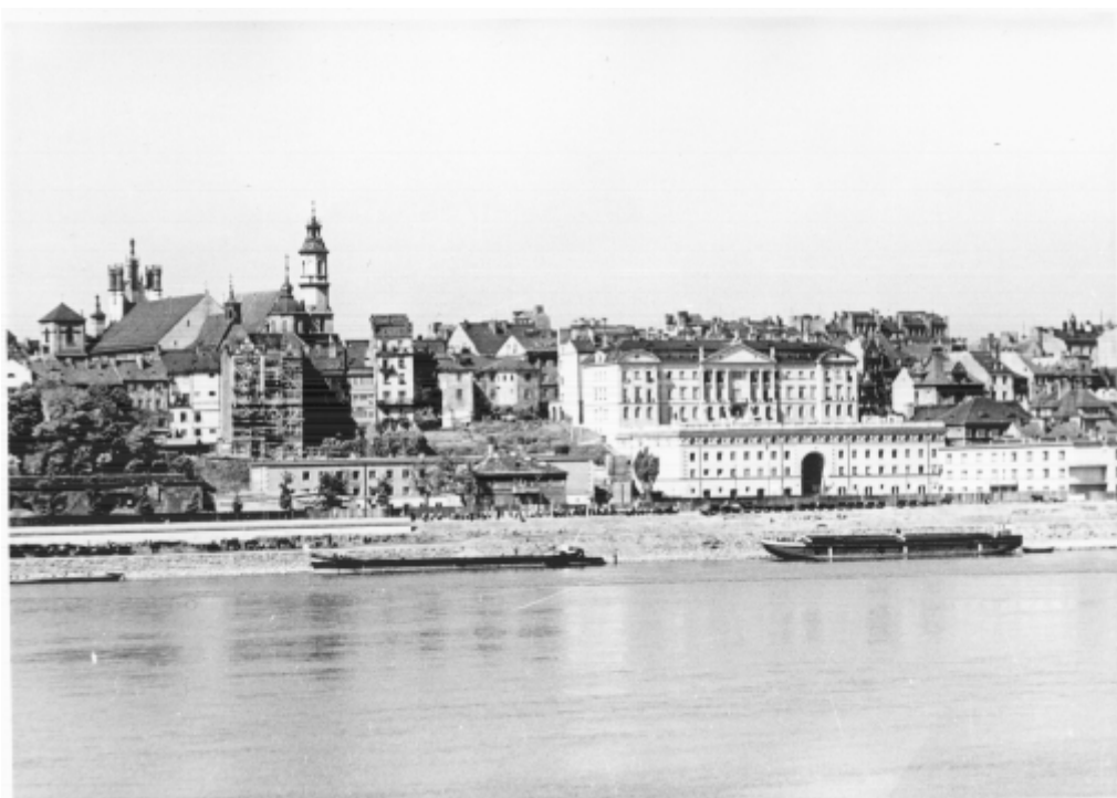
Panorama Starego Miasta od strony Wisły. 1938 r.