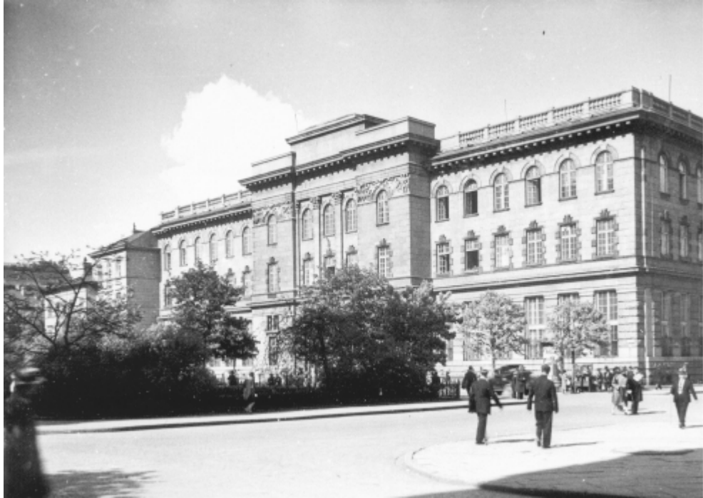
Plac Napoleona, gmach Poczty Głównej. 1930 r.