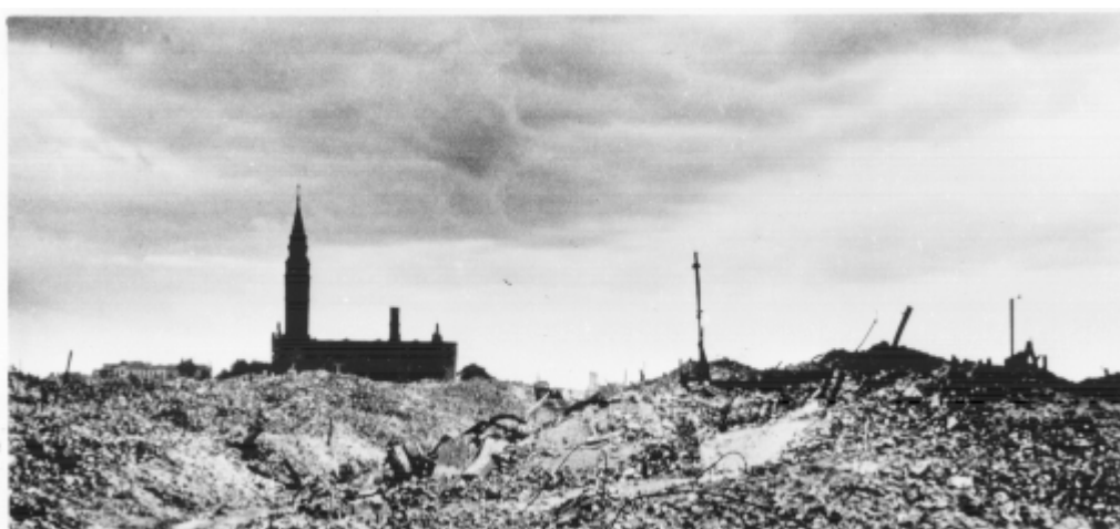
Ruiny getta i kościół św. Augustyna. 1945 r.