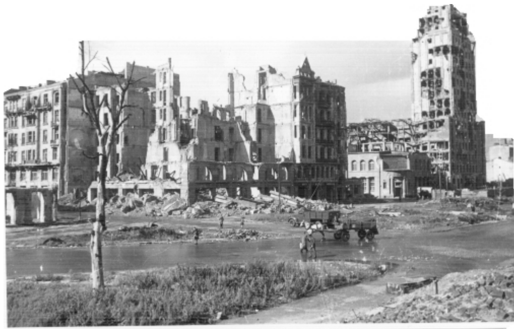
Plac Napoleona (obecnie Powstańców Warszawy) 1945/46