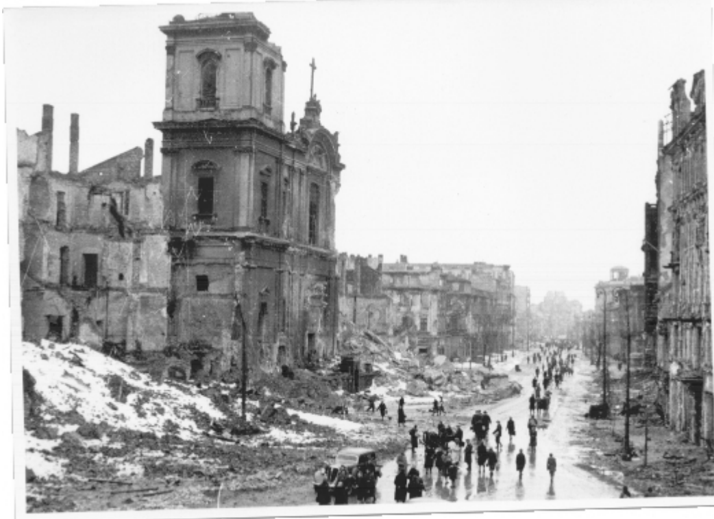
Krakowskie Przedmieście. Luty 1945 r.