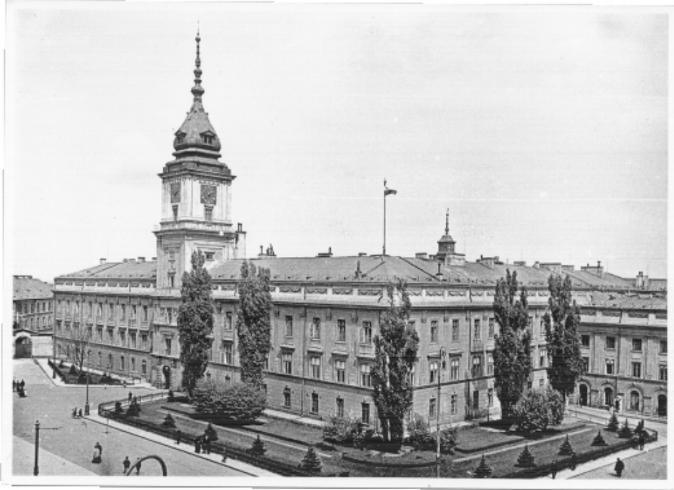
Zamek Królewski w Warszawie. Fot. H. Poddębski, 1924 r. Ze zbiorów Muzeum Historyczne w Warszawie