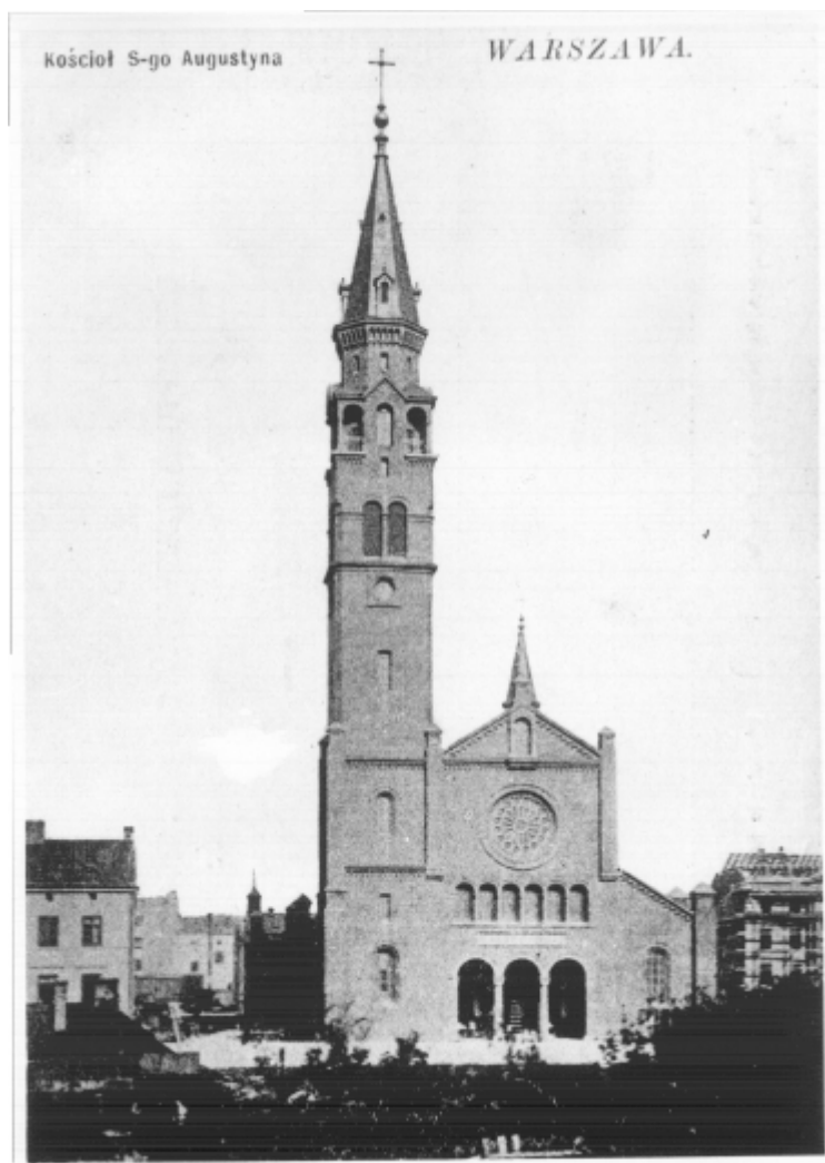
Kościół św. Augustyna. Poczтівka z ok. 1900 r.