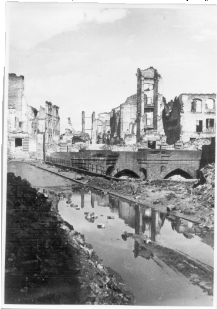
Mury obronne. marzec 1945 r.