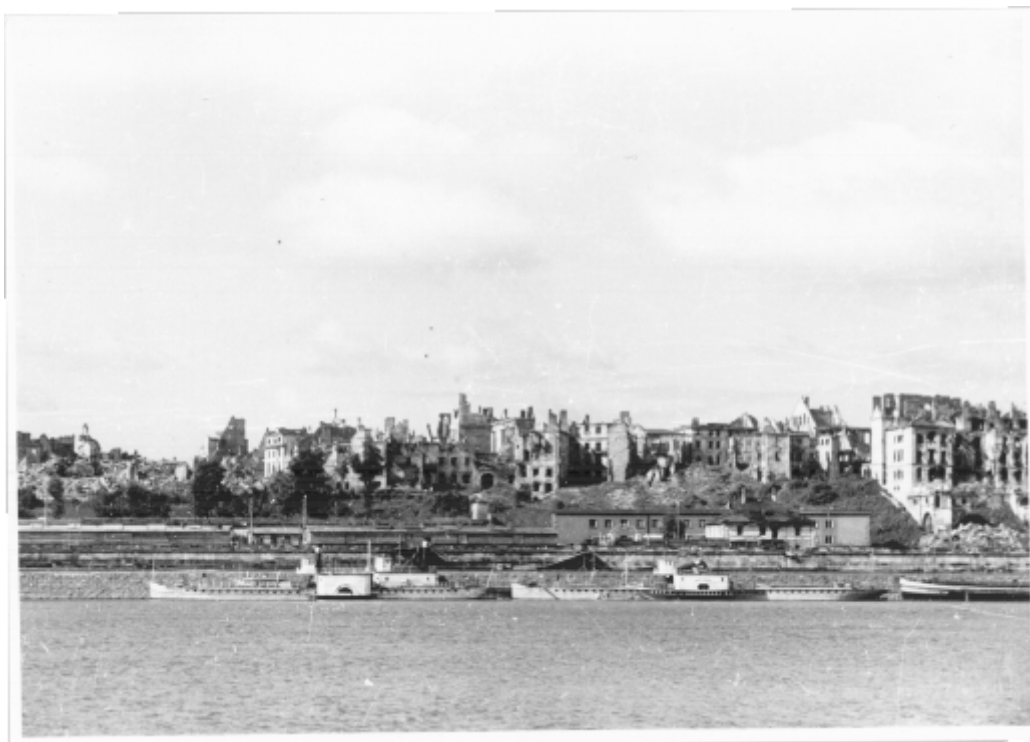
Ruiny Starego Miasta. 2. października 1947 r.