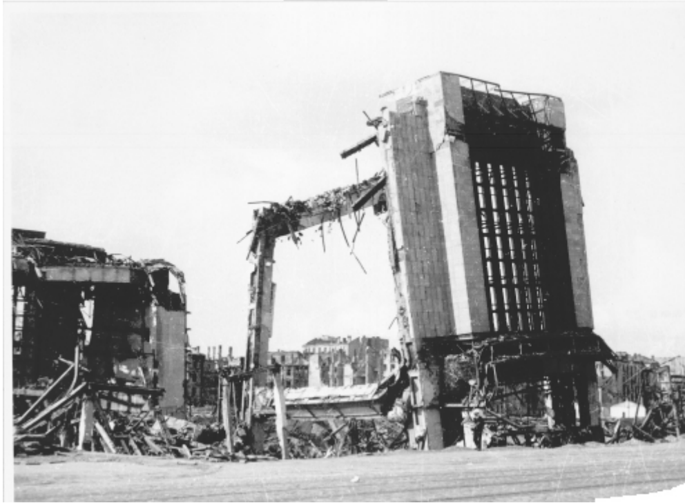
Ruiny Dworca Głównego. Koniec 1945 r.