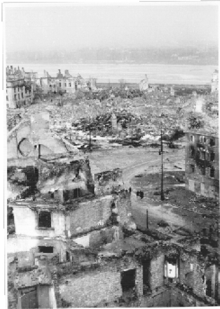
Widok na Plac Zamkowy i ruiny Zamku Królewskiego. luty 1945 r.